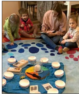
Wer lässt sich wählen?

Liebe Gemeinde, Partizipation im Kindergarten? - Ja, das geht! In unserem Kindergarten gibt es diverse Situationen, wo den Kindern ein Mitbestimmungsrecht eingeräumt wird. So entscheiden z. B. die Kinder, welche Lebensmittel sie für unser Cafeteriabuffet mitbringen möchten. Im Morgenkreis dürfen die wechselnden Kreiskinder z. B. Lieder und Spiele auswählen, die dann gemeinsam gespielt werden. Aber kennen Sie auch schon unser Kinderparlament? Seit ein paar Jahren haben wir im Kindergarten ein Kinderparlament. Im Kinderparlament können die Kinder ihre Themen / Fragen einbringen, oder sie entscheiden über bereits zuvor diskutierte Themen aus den einzelnen Gruppen. Wie in der Politik muss man allerdings auch in unser Parlament gewählt werden. Im Januar war es wieder so weit. Aufregung lag in der Luft, denn die Wahl der Gruppensprecher stand an. Wer lässt sich zur Wahl aufstellen? / ob ich wohl gewählt werde? / traue ich mich auch ohne meinen Freund / Freundin ins Parlament? ... Nachdem jedes Kind entscheiden konnte, ob es gerne Gruppensprecher werden möchte, wurde im Morgenkreis