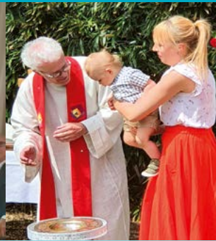
Open-Air Taufe an Pfingsten im Senkgarten