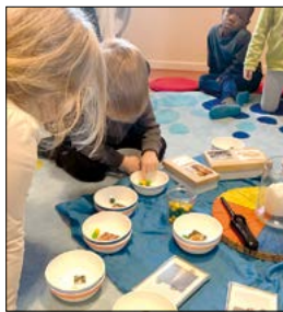
Auszählen der Stimmen