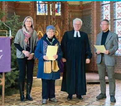
Verabschiedungen aus dem Ehrenamt

21. Mai | 17 Uhr Konzert Gregorian Voices