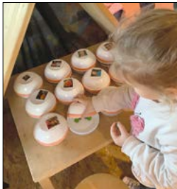
Wahl der Gruppensprecher