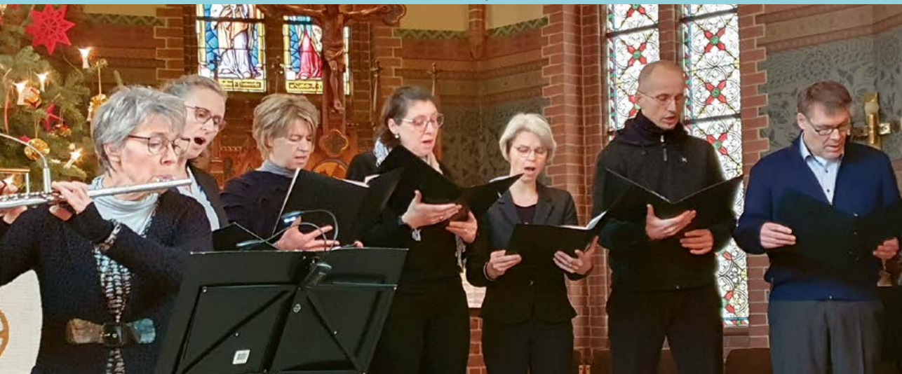
Musikalische Begleitung durch die LudgerCombo am 2. Weihnachtstag