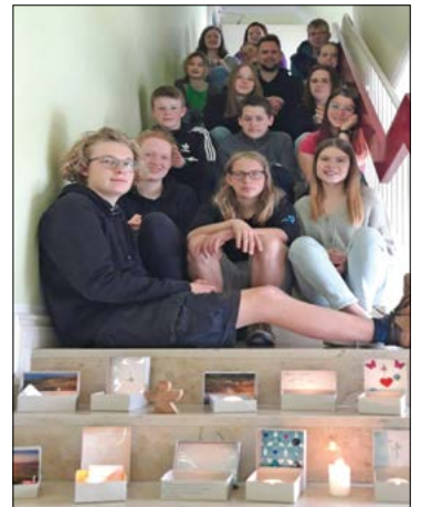
„Altar to go“ | Foto: A. Behling