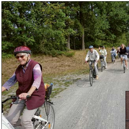
Gemeinsam unterwegs

Im Anschluss an den Besuch der Schleuse führt die Radtour nach Fallersleben, wo sie bei einem gemeinsamen Imbiss im schönen Garten am Gemeindehaus endet. /pk