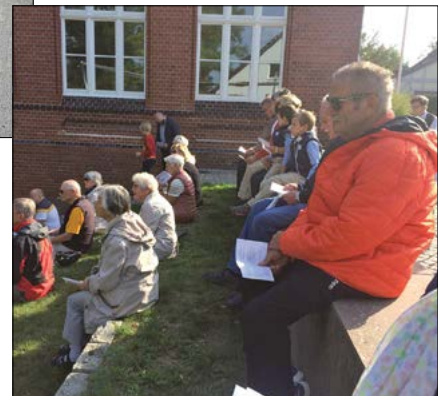
Andacht im Senkgarten

In Sülfeld lassen wir uns die Schleuse und den Kanal erklären. Vielleicht besteht ja auch die Möglichkeit, einen Einblick in den Alltag der Kanalschiffer zu erhalten. An der Schleuse, die am