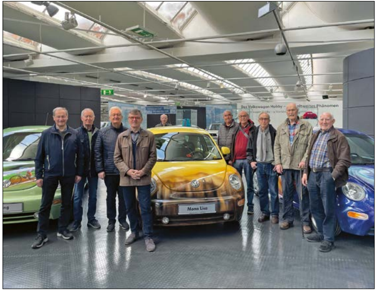
Der Männerkreis besuchte das Automuseum

Wie in jedem Jahr sind auch in diesem Jahr wieder Ausflüge des Männerkreises vorgesehen. Der erste Ausflug führte uns in das Automuseum-Wolfsburg. Wir sahen eine sehr interessante Ausstellung von Fahrzeugen der Marke Volkswagen. Vom ersten VW-Käfer mit seinen vielfältigen Varianten bis zu den heutigen Fahrzeugen wurde uns alles bei der Führung gezeigt. Alle Zwischenstufen der Fahrzeugentwicklung aus den frühen 50er und 60er Jahren bis zu Studien der Neuzeit (Chico als Pate für den SMART, den Chicco als Studie für den Polo, den XL-Racer mit Ducatimotor) konnten wir betrachten. Für uns wurde auch der Schatzkasten aufgeschlossen; ein Raum mit vielen Motoren vom ersten Käfermotor bis zum W16 des Bugatti mit 1200PS. Selbstverständlich waren auch einige Prototypen dabei. Anekdoten von der Führerin wie von den Teilnehmenden rundeten das Erlebnis ab. Nach dieser tollen Ausstellung beendeten wir diesen Ausflug mit einem Mittagessen im WBG-Ausbildungsrestaurant.