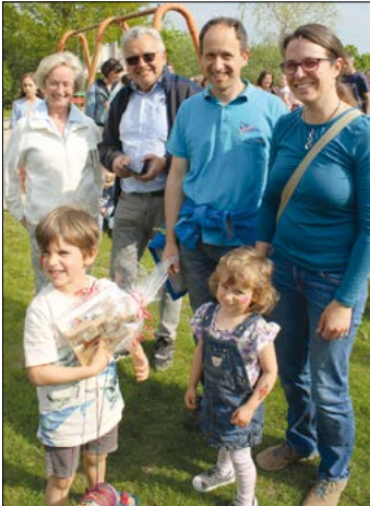
Drei Generationen bauten gemeinsam den höchsten Turm

Sind sie ein Familienmensch? Die Kinder der KerkenKita haben sich mit dieser Frage auseinandergesetzt: „Familie ist für mich, wenn wir immer zusammenhalten und immer geliebt werden“, „für mich ist Familie, wenn alle aus meiner Familie kommen“, „dass ich schön mit meiner Mama und Papa spielen kann.“ „Dass man einfach nur eine Familie hat und das ist toll“, „ich liebe meine Familie, weil ich ganz viele Omas und Opas habe und immer viel Spaß mit ihnen habe und spiele.“ „Dass immer jemand da ist, mit dem ich Fußball spielen kann.“ „Dass man sich liebt.“ „Dass ich glücklich bin.“ „Manchmal nervt sie mich, aber ich habe sie alle richtig dolle lieb.“